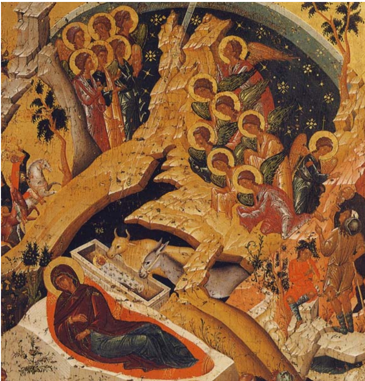
Βυζαντινή εικόνα Κρητικής Σχολής

Συγκεντρώνουμε και δείχνουμε εικόνες (από όλες τις τεχνοτροπίες και τις εποχές) με θέμα τη Γέννηση όπως και άλλες σκηνές από τη ζωή του Ιησού όπου παρίστανται ζώα. Όπως αυτές: