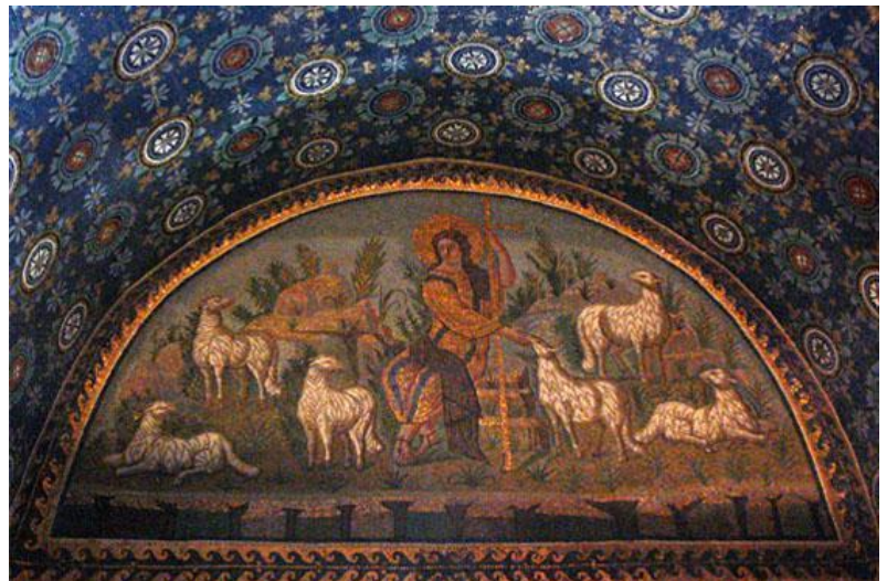
Ο Καλός Ποιμένας, τοιχογραφία από την Κατακόμβη της Δομιτίλλας, Ρώμη.

Αναγνωρίζουμε τα ζώα στις εικόνες. Περιγράψουμε την εικόνα. Πως σχετίζονται με τον Ιησού τα ζώα;