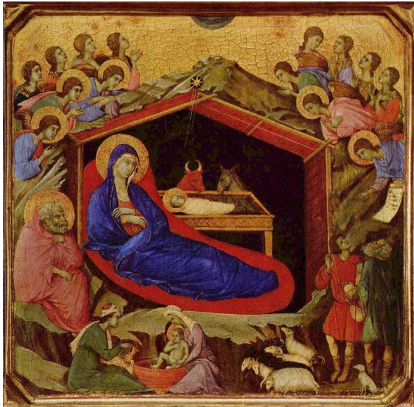
Η Γέννηση, Duccio di Buoninsegna