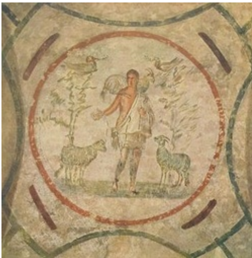
Καλός Ποιμένας, Γκάλα Πλασίντια, Ραβέννα